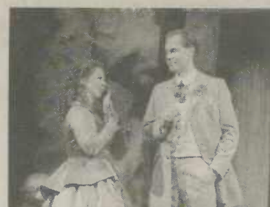
Operette "Pariser Leben"

Wie es mittlerweile schon beim Theatering Aalen Tradition ist, gastiert das Ulmer Theater am Freitag, 12. Januar 2001 mit der Operette "Pariser Leben" um 19.30 Uhr in der Stadthalle Aalen. Pariser Leben gehört zu den erfolgreichsten Werken von Jacques Offenbach. Er beschreibt die Reise von Baron und Baronin Gondremarck aus dem fernen und kalten Schweden, die endlich einmal die Stadt ihrer Träume kennen lernen wollen: Paris. Alles ist falsch in diesem "Pariser Leben": die Comtessen und die Barone, die Burtschen und der Admiral und auch die anderen Offiziere. Nur das Amüsement ist echt! Ihr Reiseleiter, ein Pariser Lebemann, treibt mit den beiden seinen Spaß. Seine Wohnung ist als Grandhotel getarnt und die vornehmen Herrschaften und Würdenträger sind eigentlich verkleidete Handwerker und