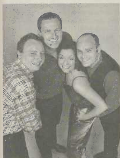
"Das Bonner Improvisationstheater Springmaus".

Das in Aalen bestens bekannte Bonner Improvisationstheater Springmaus gastiert am Donnerstag, 7. März 2002, 20 Uhr in der Stadthalle.