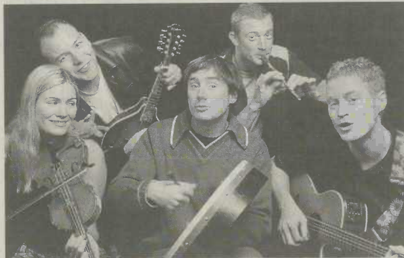
"Irish-Folk mit Guinness und Whiskey am 13. St Patrick's Day Celebration Festival" in der Festhalle in Fachsenfeld.