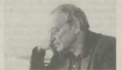
"Schriftsteller Uwe Timm"