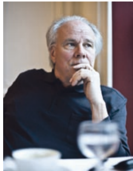
Hans Christoph Buch

Am Sonntag, 3. April 2011, wird der Schubart-Literaturpreis verliehen. Der Schriftsteller Hans Christoph Buch erhält den mit 12.000 Euro dotierten Hauptpreis für sein literarisches Lebenswerk. Die Laudatio hält der Liedermacher Wolf Biermann. Veranstaltungsbeginn ist um 11 Uhr im Aalener Rathaus.