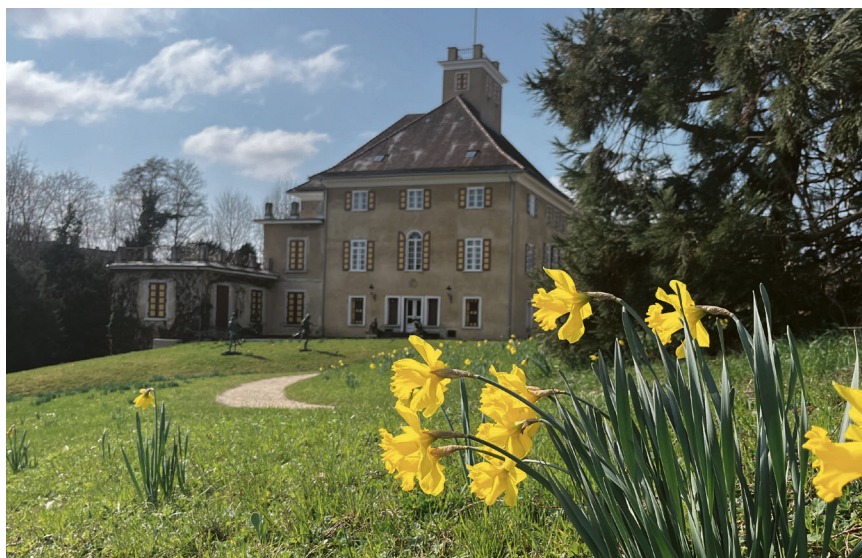
Der Park des Schlosses lädt zum Osterspaziergang ein.

Um 14 Uhr findet eine öffentliche Parkführung statt (3 EUR zzgl. Eintritt); bei schlechtem Wetter wird alternativ eine Schlossführung angeboten. Auch für junge Besucher gibt es etwas zu entdecken: Der Osterhase hat auf Schloss Fachsenfeld ein spannendes Rätsel hinterlassen, das im Rahmen einer Oster-Schnitzeljagd gelöst werden kann.