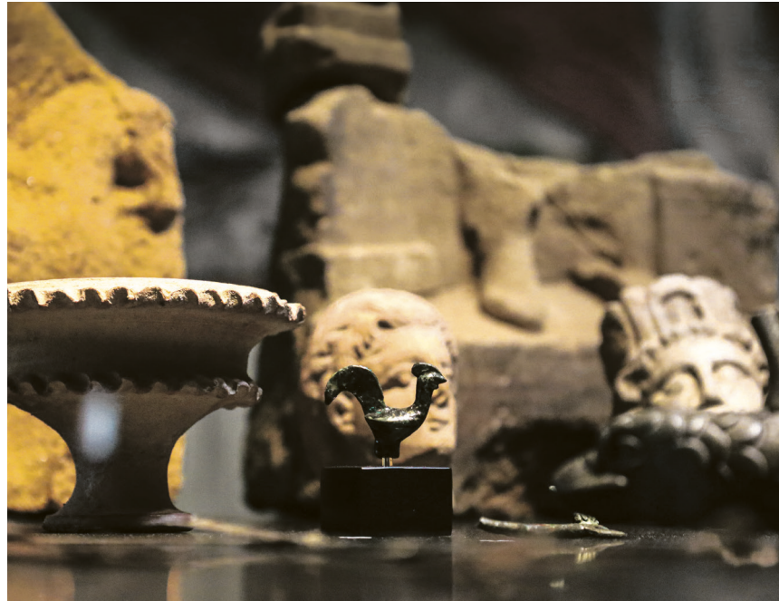
Hähne galten bei den Römern als Sinnbild von kämpferischem Mut und Wachsamkeit.

Kosten: 5 Euro für Material plus Museumseintritt (6 Euro Erwachsene/4 Euro reduziert/13,50 Euro Familienkarte). Eine telefonische Anmeldung unter 07361 528287-0 oder per E-Mail an limesmuseum@aalen.de ist erforderlich. Teilnehmen können Eltern mit Kindern ab sieben Jahren. Limesmuseum Aalen, St.-Johann-Straße 5, 73430 Aalen, Telefon 07361 528287-0, www.limesmuseum.de