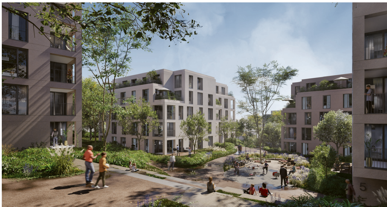
Siegerentwurf für die Umgestaltung des Hallenbad- und Gaskesselareals

Um eine städtebaulich hochwertige Lösung zu finden, führte die Investorin Ten Brinke auf eigene Kosten eine sogenannte Mehrfachbeauftragung mit