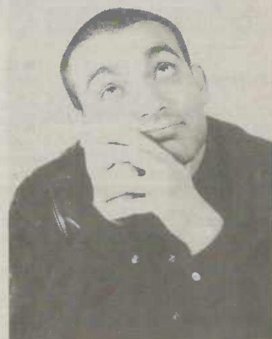
"Der bayrische Türke Django Asül"

Karten sind im Vorverkauf erhältlich beim Touristik-Service Aalen, bei Günther's