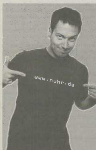
"Der Kabarettist Dieter Nuhr"

"Nuhr am Nörgeln" hieß das Programm mit dem der Düsseldorfer bekannt wurde. Und nörgeln tut er immer noch mit großer Leidenschaft. Wie gewohnt nimmt er dem Alltag mit scheinbar harmlosen Plaudereien seinen Schrecken. Die Berliner Morgenpost schrieb anlässlich der Präsentation des neuen Programms: "Nuhr beweist auch wieder einmal, wie hervorragend pointierte Stand-Up-Comedy und bissige Satire miteinander harmonisieren können. Dabei philosophiert er gern über die großen Dinge im Leben, über Gott, die griechischen Philosophen und den Urknall. ... Der Stand-Up-Kabarettist ist besser, fieser und gemeiner denn je."