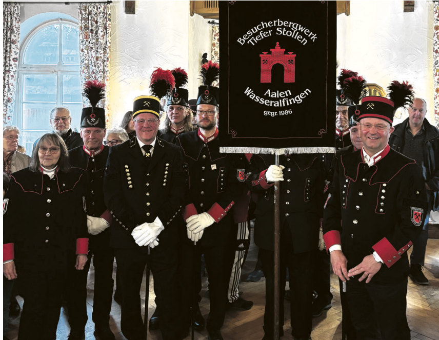
Vereinsmitglieder des Fördervereins Tiefer Stollen feiern die 40. Saisoneröffnung.