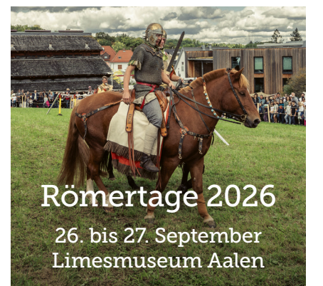
Römertage 2026 26. bis 27. September Limesmuseum Aalen

Begegnungstätte Bürgerspital, Telefon 07361 52-2501, E-Mail: buegerspital@aalen.de