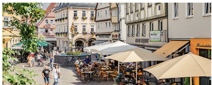
Die Innenstadt von Aalen ist eine Reise wert.

Aalen wird an zwei Terminen direkt vor Ort sein: Am 28. Juni präsentiert sich die Stadt im Landkreis-Pavillon mit Infostand, Mitmachaktionen und exklusivem „Ostalbvesper“. Am 16. Juli folgt der große „Aalen Tag“ mit rund 40 Vereinen und Organisationen – von Musik, Tanz und Sport bis zu Theateraufführungen und Interviews auf dem Roten Sofa.