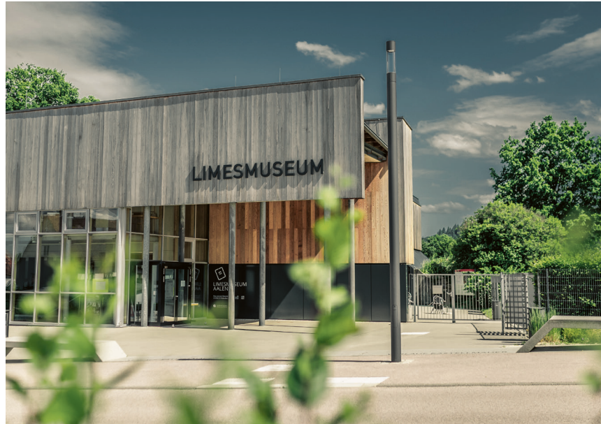
Am 12. April wird zum letzten Mal im Limesmuseum die Sonderausstellung „Fremde Nachbarn – Rom und die Germanen“ gezeigt.

Limesmuseum Aalen, St.-Johann-Straße 5, 73430 Aalen, Tel. 07361/528287-0, www.limesmuseum.de