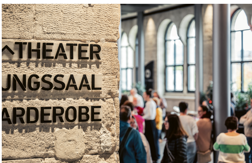
Am 28. April stellen sich die Akteure des KUBAA vor.

Erster Bürgermeister Steidle wird in einem kurzen Vortrag nicht nur auf die besondere Geschichte des KUBAA, sondern auch auf die herausragende und vor allem preisgekrönte Architektur eingehen. „Der KUBAA steht beispielhaft für unsere Vision einer Stadt, die Tradition und Moderne vereint und für unsere Verpflichtung, unser geschichtsträchtiges Erbe behutsam zu bewahren und kulturelle Orte mit Charakter und Seele zu schaffen“, so Steidle.