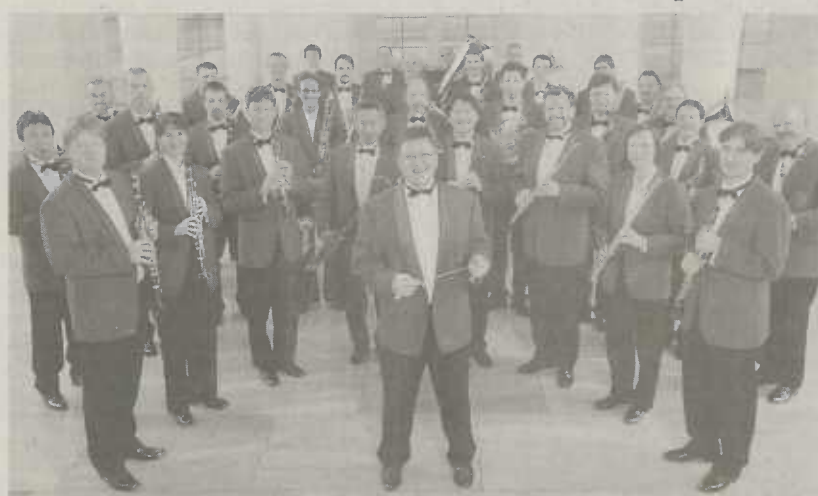
Polizeimusikkorps des Landes Baden-Württemberg

Bereits seit über zehn Jahren besteht die Initiative Sicheres Aalen, kurz ISA, die sich im Rahmen der Kommunalen Kriminalprävention gründete. Stadt, Polizei aber auch viele andere Organisationen arbeiten erfolgreich daran, dass Aalen sicherer wird. Es geht dabei vor allem darum, Kriminalität erst gar nicht entstehen