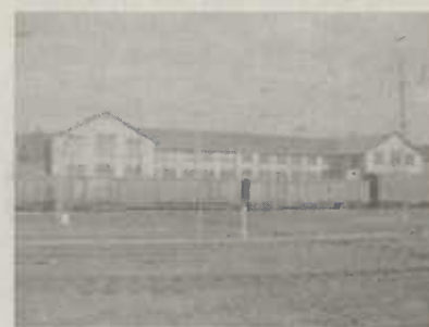
"Ehemaligen Reichsbahnausbesserungswerk (heute Baustahl-gewebe)"

Reichsbahnausbesserungswerk Das ehemalige Reichsbahnausbesserungswerk befindet sich wenige hundert