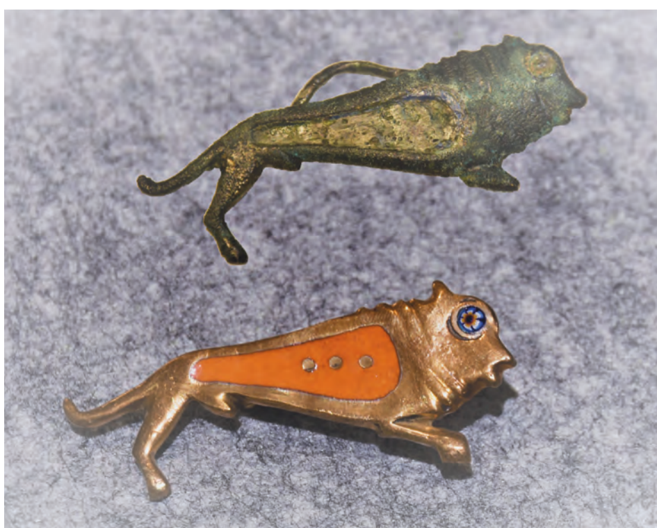
Original (oben) und Replik einer Fibel, die im Limesmuseum ausgestellt ist.

Weitere kleine Aktionen sowie ein Angebot von Kaffee und Kuchen im Museumscafé runden den Nachmittag ab.