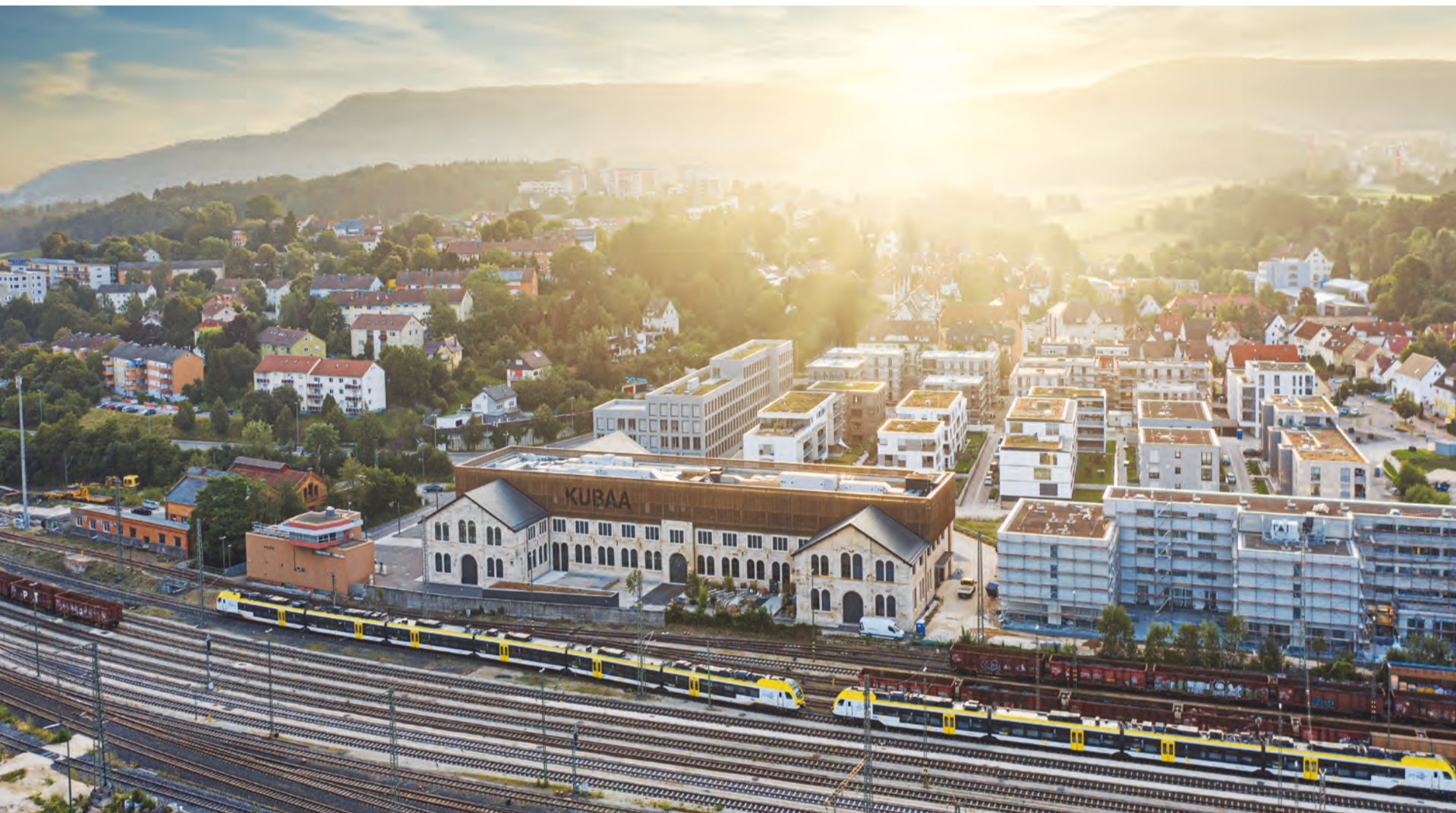
Das Stadtoval mit KUBAA im Vordergrund.