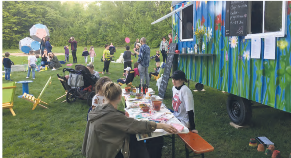
Der Blauwagen bietet an monatlich wechselnden Stationen jeden Mittwoch- und Donnerstagnachmittag zahlreiche Angebote für Kinder.

An den verschiedenen Spielangeboten sind einzelne Künstlerinnen und Künstler, aber auch Institutionen wie explorino beteiligt, an manchen Nachmittagen kann getanzt oder Theater gespielt werden, an anderen wird mit Naturmaterialien gebastelt oder es werden Raketen gebaut. Gefördert werden die Angebote von der Baden-Württembergischen Stiftung Kinderland und dem Deutschen Kinderhilfswerk. Im Juli wird der Bauwagen am Haus der Jugend, im August vor dem Schloss Wasseralfingen stehen. Informationen zum Programm gibt es vor Ort oder beim Haus der Jugend.