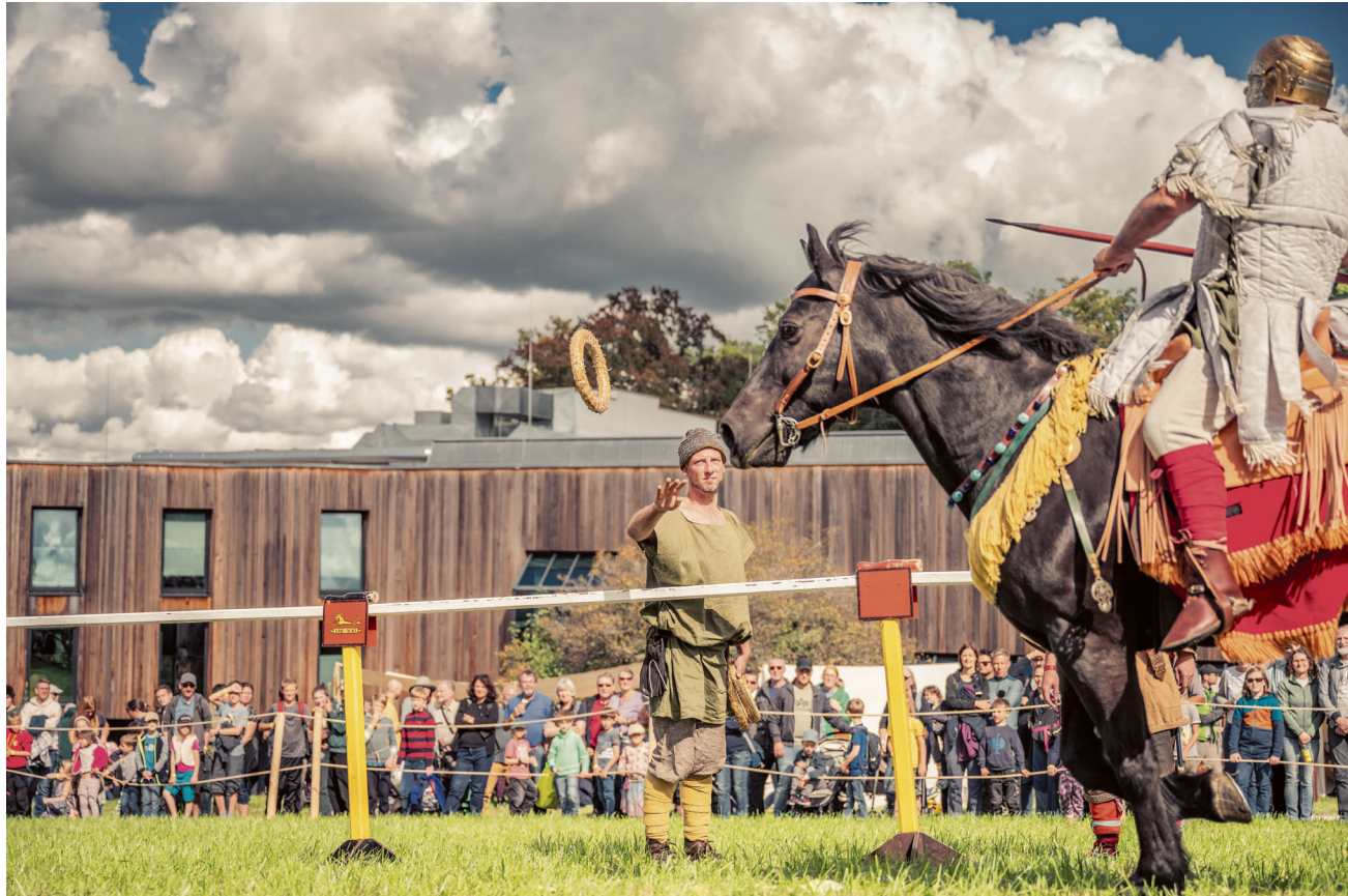
Bei den Römertagen wird wieder ein buntes Programm geboten.

Das zivile, handwerkliche und militärische Leben in der römischen Provinz Raetien während des 3. nachchristlichen Jahrhunderts präsentieren die