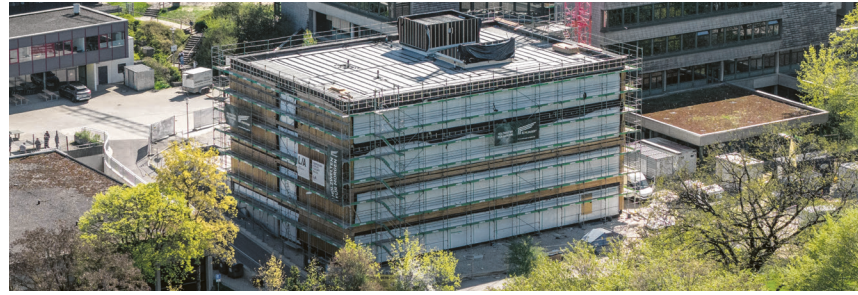
Der Neubau an der Karl-Kessler-Schule macht sichtbare Fortschritte.