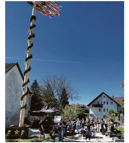
Maibaumfest in Unterrombach

Ein fester Bestandteil des Festes war einmal mehr der Auftritt des Posaunenchors der evangelischen Kirchengemeinde Unterrombach. Unter der Leitung von Heidrun Meiswinkel präsentierte der Chor eine abwechslungsreiche Auswahl an Liedern zum Start in den Mai. Mit dem schwungvollen „Aux