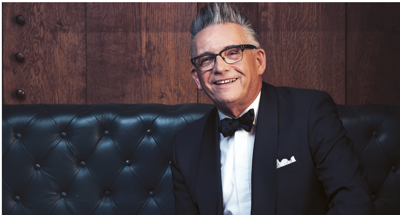
Götz Alsmann ist am 6. Dezember im Rahmen des Kleinkunst-Treffs in der Stadthalle zu Gast.

Im Abonnement enthalten sind fünf anregende Kleinkunst-Abende, mit bekannten Namen, aber auch Newcomern jedes Genres. Abonnenten haben stets den gleichen, selbst ausgewählten Sitzplatz in der Aalener Stadthalle und profitieren von einem deutlichen Rabatt gegenüber den Einzelkartenpreisen.