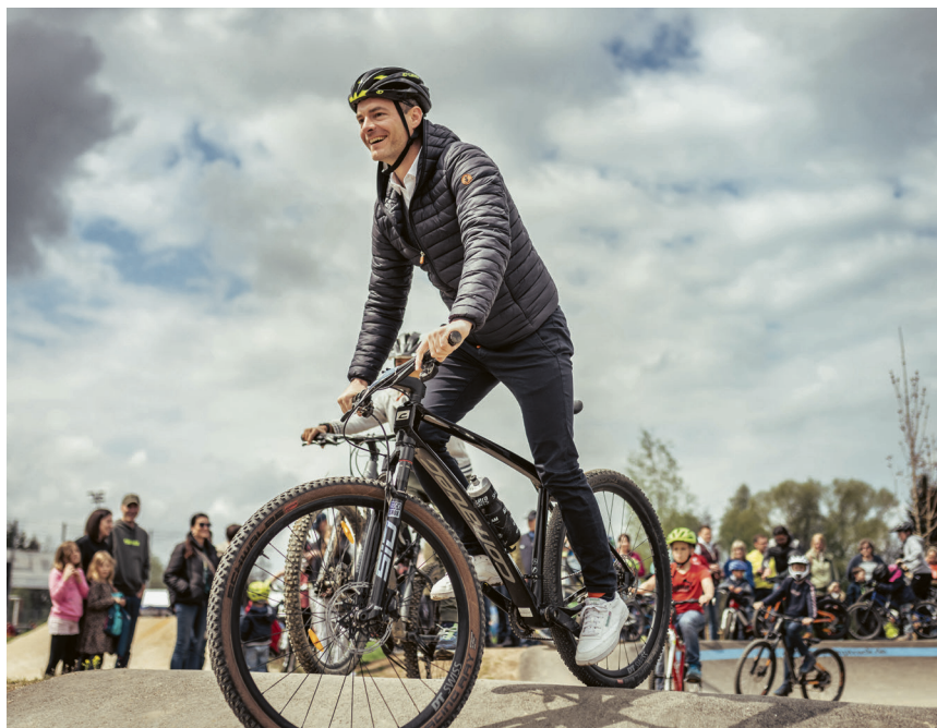
Von 16. bis 18. Juni dreht sich in Aalen alles ums Mountainbiken.

Vom 16. bis 18. Juni findet der 9. deutsche Mountainbike-Kongress unter dem Motto „NEUE HORIZONTE“ in Aalen statt. Die größte deutschsprachige Fachveranstaltung für naturnahes Radfahren bringt Akteurinnen und Akteure aus Tourismus, Verwaltung, Politik und Bike-Community zusammen, um sich auszutauschen und die Zukunft des Bikens gemeinsam weiterzudenken. Veranstalter sind das Mountainbike Forum Deutschland mit den diesjährigen Destinationspartnern Schwäbische Alb Tourismus und der Stadt Aalen.