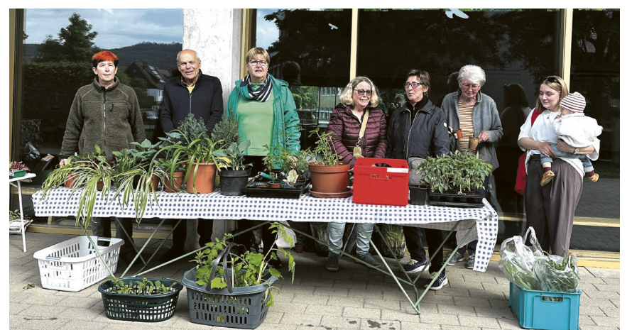
Erste Pflanzentausch- und Verschenkbörse in Unterrombach-Hofherrnweiler

Kulturclub Antakya-Aalen e. V. zu veräußern. Die Veranstaltungen und Treffen der knapp 200 Mitglieder starken Heimatgruppe der Böhmerwäldler finden künftig in anderen Räumen statt. Für den Kulturclub Antakya-Aalen bietet das Vereinsheim mit seinem Raumangebot, dem großzügigen Grundstück und ausreichenden Parkmöglichkeiten, gute Voraussetzungen, seine Kultur zu pflegen, insbesondere auch für Familien sowie im Kinder- und Jugendbereich.