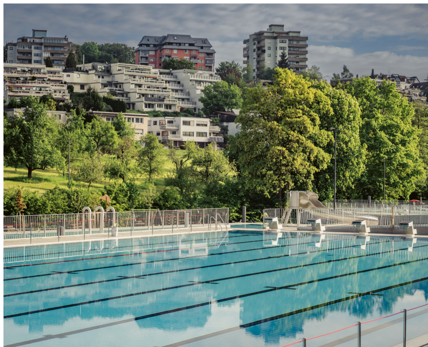
Das Freibad im Hirschbachtal wartet auf seine ersten Besucherinnen und Besucher.