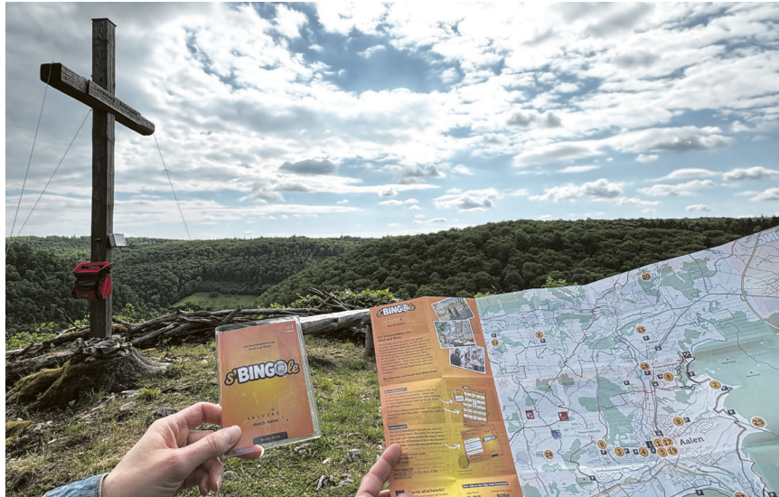
Unterwegs am Zwerenberg Nebengipfel - mit „s'BINGOle“ die Vielfalt Aalens kennenlernen.

Herzstück der Aktion ist eine Bingo-Karte, die die Teilnehmenden durch den gesamten Sommer begleitet. Insgesamt 24 ausgewählte Ausflugsziele gehören zu „s'BINGOle“ – von bekannten Highlights bis hin zu versteckten Ecken, die selbst Einheimische überraschen dürften. An jedem dieser Orte ist ein individueller vierstelliger Code angebracht, meist auf kleinen Hinweisschildern.