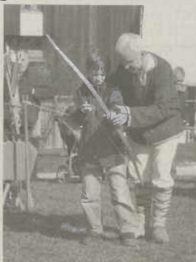
"Pfeil- und Bogenschießen auf dem Kastellgelände"

Derzeit ist im Limesmuseum die Sonderausstellung "Formschön" zu sehen. Zum einen wird das breite Spektrum römischer Metallgefäße vom ersten Jahrhundert vor Christus bis zum vierten Jahrhundert nach Christus gezeigt. Zum anderen stellt die in Aalen lebende und gelernte Designerin Ulrike Langen einen Querschnitt ihrer Vasen und Bilder aus der griechischen und römischen Antike aus. Durch diese Ausstellungen werden um 15 und 16 Uhr Führungen angeboten. Führungen finden auch durch das UNESCO-Kastellgelände um 14.30 und 15.30 Uhr statt.