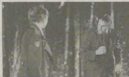
Szenenbild aus dem Stück „Die heilige Johanna der Schlachthöfe“

Sonntag, 6. Mai 2010 | 19 Uhr | Altes Rathaus „Populärmusik aus Vittula“ von Mikael Niem. Souppkultur.