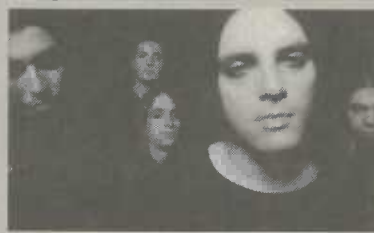
"End of green"

Als Hauptacts konnten die Aalener Band "G-Spot" mit ihrem funkig-knackigen Sound und "End of green" verpflichtet werden. Das Stuttgarter Quintett kommt in diesem Jahr mit seinem dritten Album "Songs for a dying world" heraus. Der Band gelingt es, die Grenzen zwischen metal, gothic, doom, indie, hardcore und rock zu verschmelzen. Grungig und sehr rockig lassen es auch "It's missing" aus Aalen knacken, die ge-