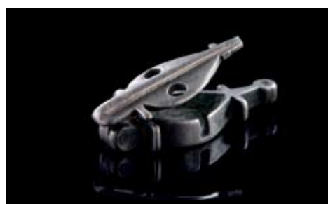
Silberne Siegelkapsel aus der Grabung Gartenstraße.

Gleich drei neue Sonderausstellungen werden eröffnet. Im Mittelpunkt stehen dabei die neuesten Funde aus dem römischen Aalen, die erst vor kurzem bei einer archäologischen Grabung des Landesamtes für Denkmalpflege unweit vom Kastell entfernt entdeckt wurden. Spannende Alltagsgegenstände wie filigrane Haarnadeln, zahlreiche Gebrauchsgegenstände oder Metallfunde wie römische Schlüssel, Beschläge oder Schuhnägel, aber auch Teile eines Arztbestecks oder eine silberne Siegelkapsel bieten einen einmaligen Blick auf das Alltagsleben der Bewohner der römischen Siedlung.