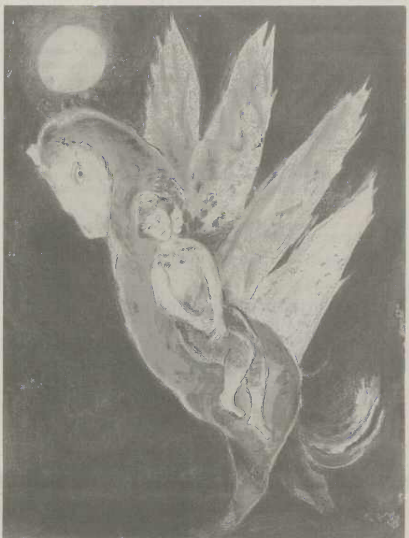
„Arabische Nächte“ von Marc Chagall

Während der Ausstellung sind bis zum Herbst eine Reihe von Begleitveranstaltungen geplant. Märchenabende für Erwachsene und Kinder führen in die Welt der arabischen Nächte. Kinder können, inspiriert von den farbenfrohen Bildern unter Anleitung des Künstlers Simon Maier selbst zu Pinsel und Farbe greifen, und ein Malwettbewerb für Kinder von sechs bis zwölf Jahren lockt mit schönen Preisen.