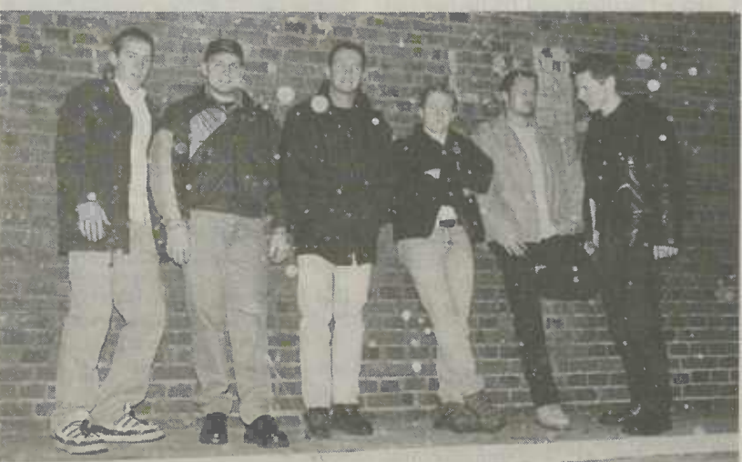
"B.A.B. The Bryan Adams Coverband"

"B.A.B." beschränkt sich nicht darauf, einfach vor der Zuhörerschaft zu spielen. Mit der Musik von Bryan Adams schaffen sie es bereits nach wenigen Takten, das Publikum voll in jeden einzelnen Song mit einzubeziehen. Ob fetzige, abgeheulte Rocksongs oder gefühlvolle Balladen, "B.A.B." sieht man es bei jedem Song an, das sie hinter der Musik stehen und riesigen Spaß an ihr haben. Wer „B.A.B.“ also noch nicht erlebt hat oder wieder einmal mit ihnen eine Rock'n Roll - Party feiern möchte, darf ihr Open-Air Konzert auf der Westumgehungs, nicht versäumen.