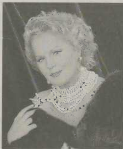
"Sopranistin Katia Ricciarelli"

Eintrittskarten sind erhältlich bei den Vorverkaufsstellen Touristik-Service Aalen,