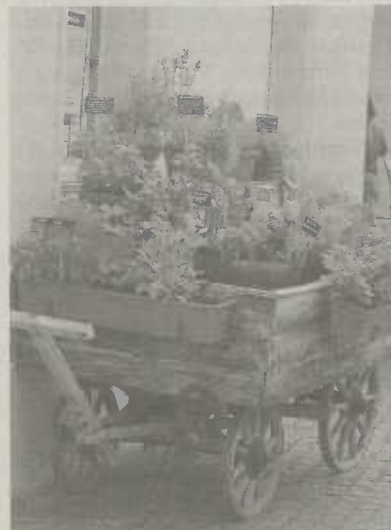
"Kräuterwägle am Urweltmuseum"

Das Kräuterwägle: Ein liebevoll bepflanzter Leiterwagen inmitten der reizvollen Kernstadt, nahe dem Brunnen am Marktplatz, erweist sich aufgrund seines gehaltvollen Aromaduftes nicht nur als Augenweide. Die Umsetzung der Idee