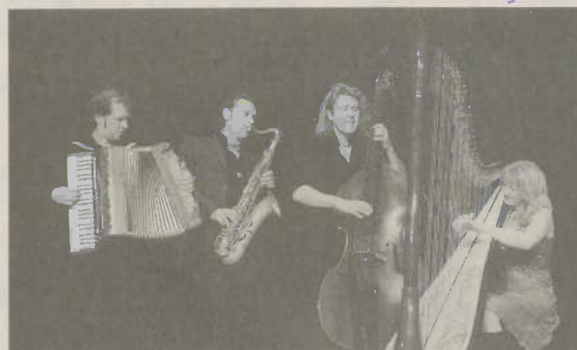
Die Gruppe „Quadro Nuevo“

In diesem Jahr startet das Internationale Festival bereits am Donnerstag 2. Juli 2009 mit einem Konzert der Gruppe „Quadro Nuevo“ um 20.30 Uhr im Café Magazine.