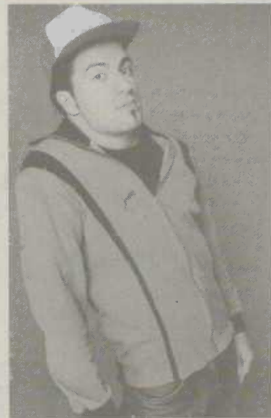
"Der Kabarettist Bülent Ceylan"

Eben noch der harmlose, leicht verblödete Mannheimer Vorstadtbewohner Harald, wandelt er sich in Sekundenschnelle zum türkischen Gemüsehändler Aslan, um sich dann als proletenhaft auftrumpfender Macho Hasan zu blamieren. Egal wen der 27-jährige Mannheimer Halbtürke auch darstellt, er überzeugt durch Authentizität, ausgefeilte Texte und durch einen gelungenen Spagat zwischen den diversen Comedy-Genres. Er jongliert mit den Eigenheiten und Widersprüchen unter-