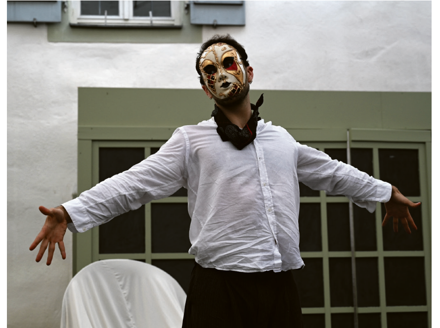
Eine Szene aus dem Stück „Heute: Ein weißer Elefant“, das Premiere feiert.