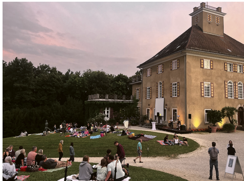
Das beliebte Sternpicknick ist eines der Highlights im Sommer auf Schloss Fachsenfeld.