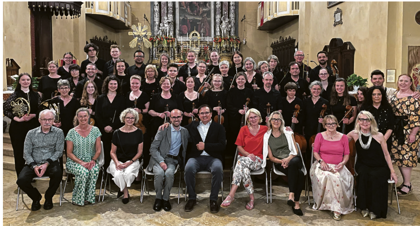
Erster Bürgermeister Wolfgang Steidle und Bürgermeister von Cervia Sindaco Mirko Boschetti (1. Reihe mittig) mit der Aalener Delegation, dem Aalener Sinfonieorchester sowie Vertreterinnen und Vertreter der Stadt Cervia in der Cattedrale Maria Assunta

Bei der Eröffnung der Cervia Gartenstadt traf Aalens Erster Bürgermeister Wolfgang Steidle den frisch gewählten neuen Bürgermeister von Cervia, Sindaco Mirko Boschetti.