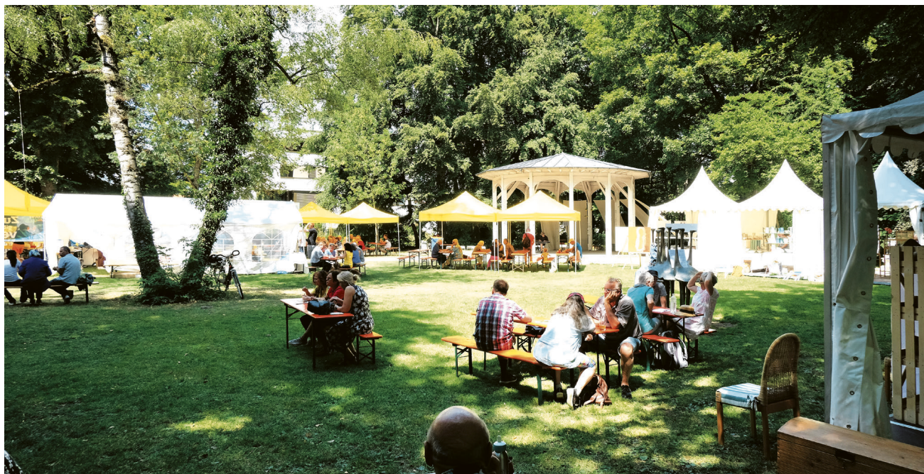
An 25 Ständen werden kunsthandwerkliche Produkte präsentiert und zum Verkauf angeboten.

Der gesamten Planung liegt der Nachhaltigkeitsgedanke zugrunde: So werden ausschließlich vegane oder vegetarische Speisen angeboten, es gibt ein Mülltrennungskonzept und alle Einwegeleiten werden ausgeschlossen. Der Stadtgarten selbst ist durch seine Lage in der Nähe des Bahnhofs mit