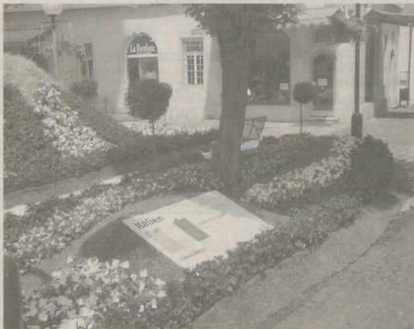
"Italianische Landschaft an der Stadtkirche"

Seit zweieinhalb Wochen blüht es in der Stadt weltmeisterlich.