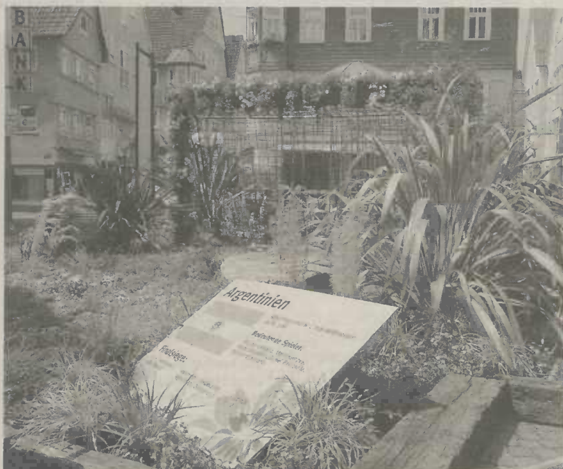
Ein großer symbolhafter Fußballschuh und elf Säulen stehen für "elf Freunde".

Mexiko reichte es zur höchsten Fußballerehre. Diesen weltmeisterlichen Glanz nimmt auch die Gestaltung der Reichsstädter Straße durch die Gärtnerei Goldammer (Tannhausen) auf. Ein großes bepflanztes Tor steht im Mittelpunkt der Präsentation. Entsprechend den Nationalfarben weiß und blau sind auch die Blumenarrangements gestaltet, die mit gelben Untertönen für mehr Leuchtkraft sorgen. Ein großer symbolhafter Fußballschuh und elf Säulen stehen für "elf Freunde". Gesteinsbrocken, Eisenbahnschwellen und viele Gräser erinnern an die große Weite und einzigartige Landschaft Südamerikas.