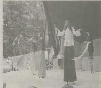
Stelzenläufer der Sporttheater AG

Auf der Bühne vor dem Rathaus um 15.30 Uhr.