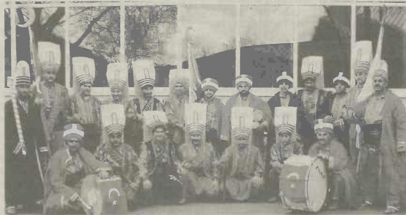
“Mehter Takimi - Osmanische Militärmusik”

wurde darauf geachtet, dass sie den Feind beim Angriff ängstigen sollten und die eigenen Soldaten in Begeisterung versetzten. Als die Osmanen im 17. Jahrhundert bis nach Europa kamen, fanden auch Elemente der Mehter-Musik Eingang in die europäische Musik.