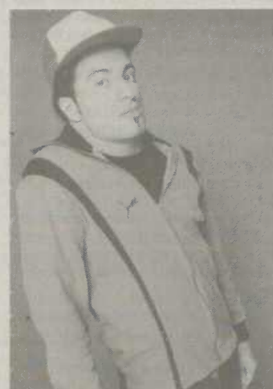
Kabarett mit Bülent Ceylan: "Produzier mich net"

Eben noch der harmlose, leicht verblödete Mannheimer Vorstadtbewohner Harald, wandelt sich Bülent Ceylan in Sekunden-schnelle zum türkischen Gemüsehändler Aslan, um sich dann als proletenhaft auf-trumpfender Macho Hasan zu blamieren. Egal, wen der 27-jährige Mannheimer Halbtürke auch darstellt, er überzeugt am Donnerstag, 10. Juli 2003 im Aalener Rathaus, 20 Uhr durch Authentizität, ausgefeilte Texte und durch einen gelungenen Spagat zwischen den diversen Comedy-Genres. Karten sind im Vorverkauf erhältlich beim Touristik-Service Aalen, Telefon 07361 52-2359.