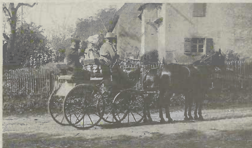
Fotoausstellung: „Fachsenfelder Landpartie(n)“

Auch die Musik wird auf Schloss Fachsenfeld besondere Akzente setzen. Mit dem Motto des Programms, das den Auftakt