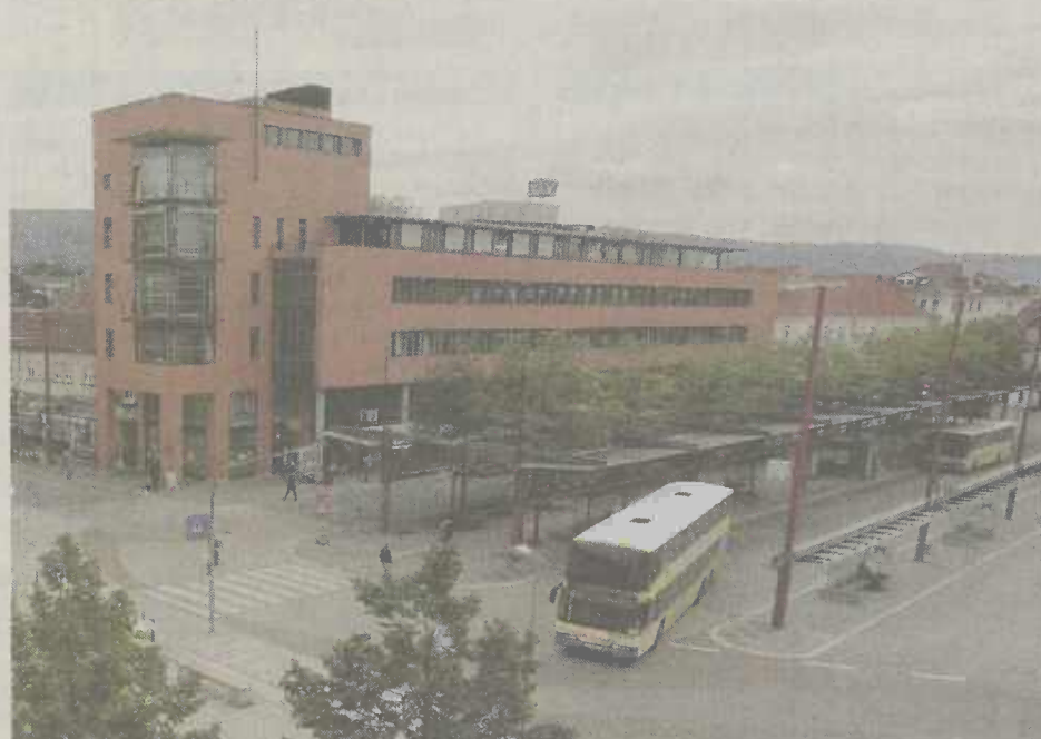
Knotenpunkt für den öffentlichen Personennahverkehr - Aalener Busbahnhof.

Ziel der Umfrage ist es, die Chancen dieser Renaissance für die künftige Entwicklung des ÖPNV abzuschätzen und daraus Strategien für die Stadt- und Verkehrsplanung zu entwickeln. In der wissenschaftlichen Untersuchung werden Regionen mit prognostiziertem Wachstum, Mittelzentren und schrumpfende Regionen darauf hin untersucht, welche Perspektiven sich für den ÖPNV ergeben. Welche Lebens- und Mobilitätsstile pflegen die „bewussten Stadtbewohner“ in den drei Modellstädten Hamburg, Dresden und Aalen? Warum haben sich die Befragten gerade für diesen Wohnstandort entschieden? Wie organisieren sie ihre Mobilität im Alltag? Die Antworten auf diese Fragen sollen zu verbesserten Strategien im Bereich Wohnen und Öffentlicher Verkehr führen. Die Forschungs-