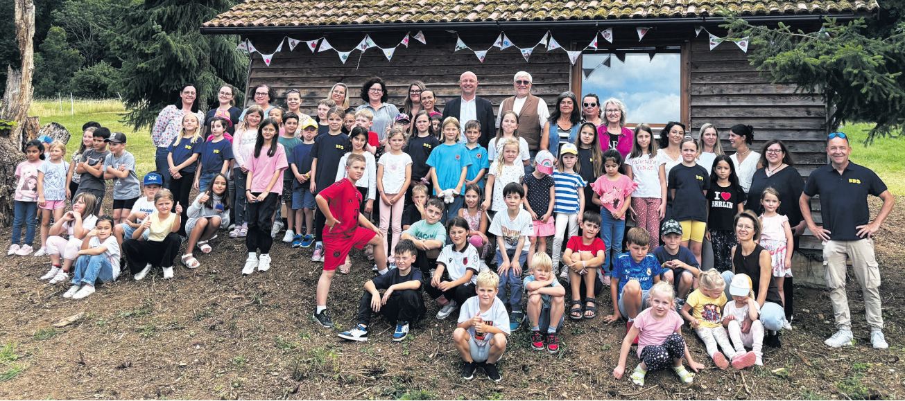
Die ehemalige Skihütte am Brauenberg wird zum Haus der kleinen Naturforscher.

Der beliebte Warenverschenktage lädt alle Bürgerinnen und Bürger herzlich dazu ein, gut erhaltene Gegenstände mitzubringen oder kostenlos mitzunehmen, ganz ohne Geld, ganz im Zeichen des bewussten Konsums. Wer selbst Dinge verschenken möchte, kann diese bereits am Freitag, 1. August zwischen 12 und 17 Uhr in der Ulrich-Pfeifle-Halle abgeben. Erlaubt sind saubere und funktionstüchtige Alltagsgegenstände wie Kleidung, Bücher, Haushaltswaren, Spielzeug oder kleine Elektrogeräte. Eben alles, was zu schade zum Wegwerfen ist und anderen noch eine Freude machen kann. Am Samstag stehen ab 9 Uhr die gesammelten Schätze dann für alle bereit. Jeder darf stöbern, entdecken und mitnehmen, was ihm gefällt, und das selbstverständlich kostenlos. Die Ver-