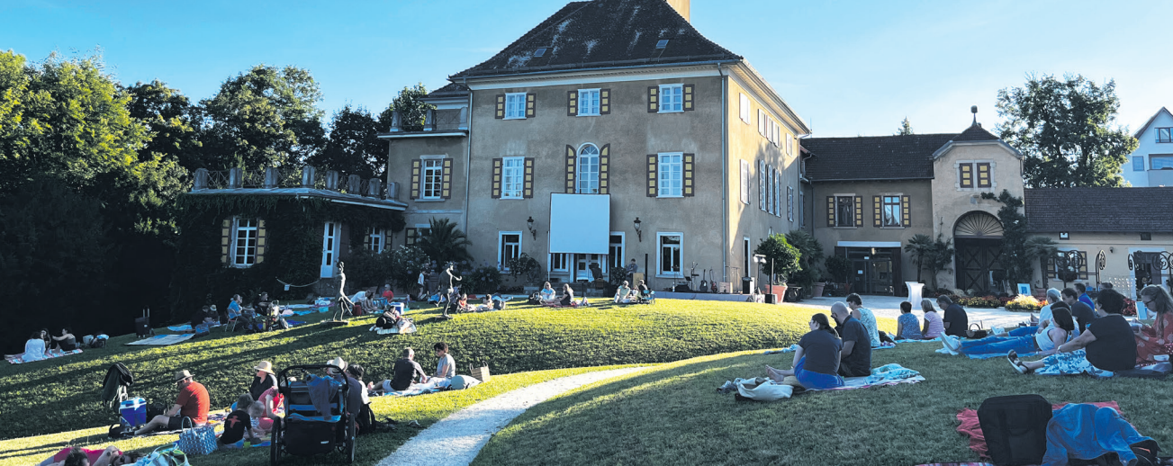
Das Sternepicknick im Park von Schloss Fachsenfeld findet dieses Jahr am Samstag, 16. August statt.

Für die besonders heißen Tage bieten auch die kühlen Innenräume von