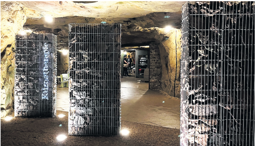
Der Eingangsbereich des Heilstollens unter Tage im Besucherbergwerk „Tiefer Stollen“.

„Zusammengefasst kann gesagt werden, dass die Heilstollentherapie bei Asthma, COPD und Long-Covid zu einer signifikanten Entlastung führt. Am deutlichsten sind die Verbesserungen bei Patienten mit Asthma. Zudem waren die Ergebnisse auch noch drei Monate nach Ende der Therapie nachweisbar“, so Dr. Schwarz.