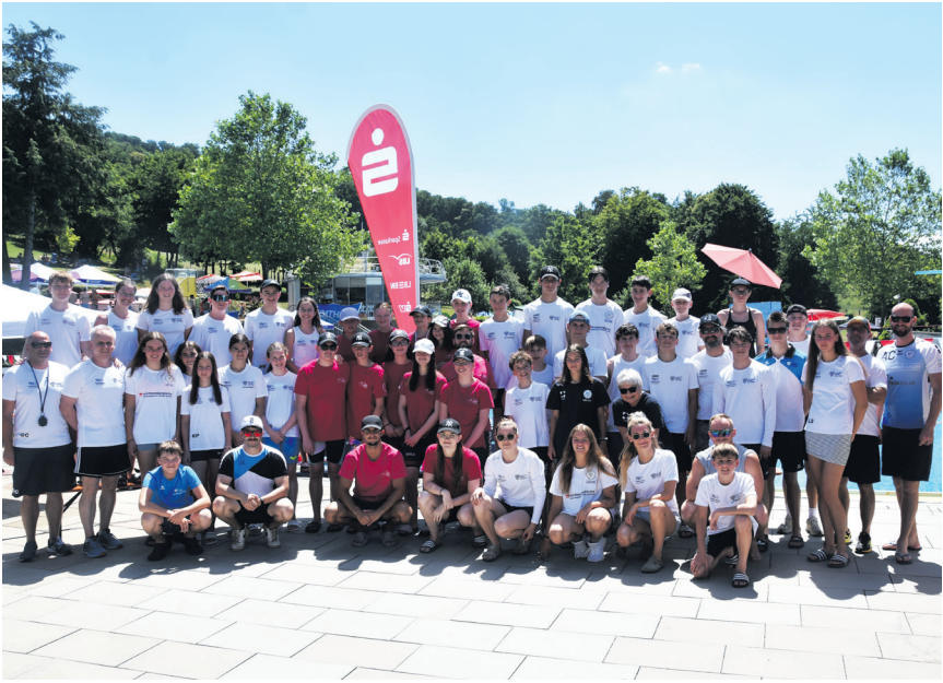
Die beiden Teams der Aalener Sportallianz (weiße/weiß-blaue Shirts) und des BCSG (pinke Shirts) beim Internationalen Schwimmfest.

sind sehr froh, dass wir unsere freundschaftlichen Kontakte zum belgischen Verein auffrischen konnten, und danken auch der Stadt Aalen für die Zusammenarbeit bei der Übersetzung und Gästebetreuung. Wir freuen uns auf weitere internationale sportliche Begegnungen.“ Möglicherweise im neuen Hallenbad, das in Saint-Ghislain noch in diesem Jahr eröffnen soll. Die belgischen Gäste waren in der Sportstätte der Aalener Sportallianz im Aalener Spieselbad untergebracht. Sie genossen nicht nur das sportliche Programm, sondern auch die herzliche Atmosphäre und Gastfreundschaft in Aalen. Ein Besuch der Wasseralfänger Festtage rundete den dreitägigen Besuch mit kulturellen Eindrücken ab. Sport verbindet grenzenlos. Die Sportlerinnen und Sportler aus Saint-Ghislain verließen Aalen mit dem Versprechen: „Wir kommen nächstes Jahr wieder!“