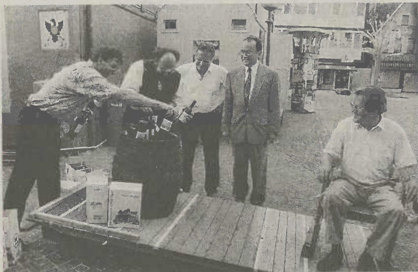
"Schon vor 21 Jahren wurde Oberbürgermeister Ulrich Pfeifle mit Weinflaschen aufgewogen."

Wegen Betriebsausflug bleiben bei der Wohnungsbau Aalen GmbH am Freitag, 26. Juli 2002 alle Abteilungen geschlossen. Wir bitten um Verständnis, sind aber am Montag darauf wieder gerne für Sie da.