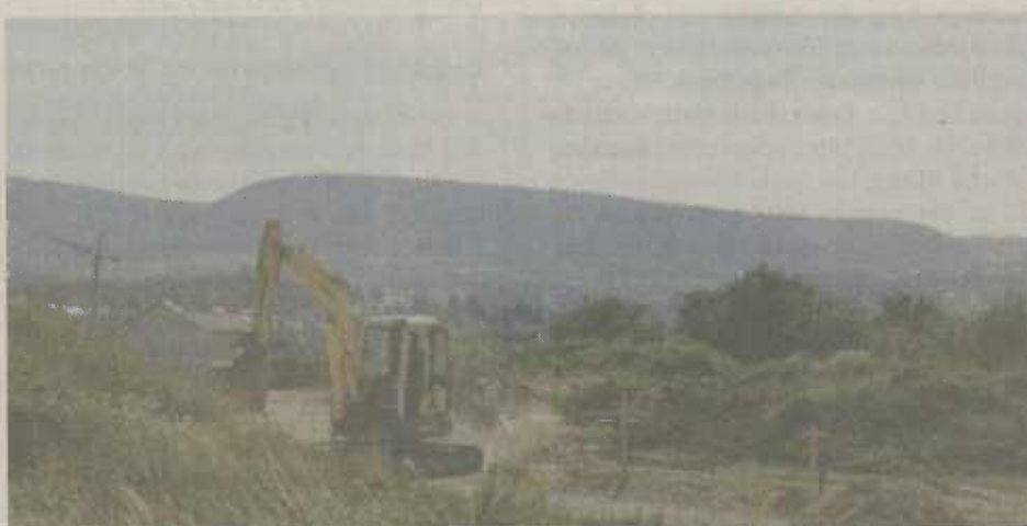
Ein herrlicher Panoramablick über Aalen und die umliegenden Berge hat man vom Baugebiet Wehrleshalde II aus.

Wer bei dem herrlichen Panoramablick über Aalen auf der Baustelle steht, hat Verständnis für die Ungeduld. Das attraktive Baugebiet ist die größte Erschließungsmaßnahme der Stadt und hat bereits Erfolgsgeschichte geschrieben. Von 48 Bauplätzen wurden seit Jahresbeginn 37 verkauft, das sind 77 Prozent. „Das Baugebiet ist eben sehr attraktiv und der Wohnstandort Aalen gefragt“ sagt