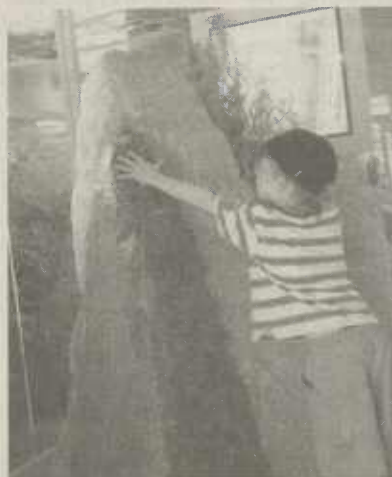
Spritzenhausplatz "Der Steinbrunnen im spiegelnden Innenraum"

Optischen Täuschungen erliegt momentan, wer bei Optik Mallwitz in der