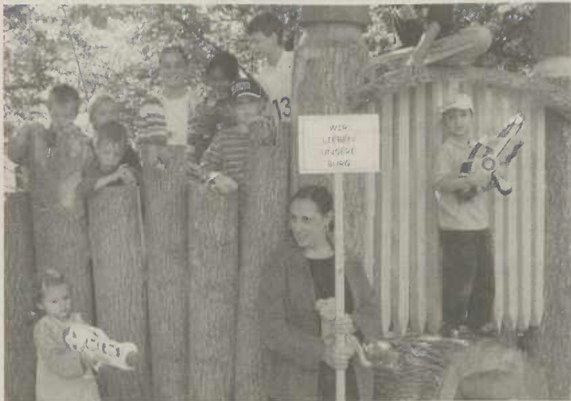
"Aalen City mit allen Sinnen"