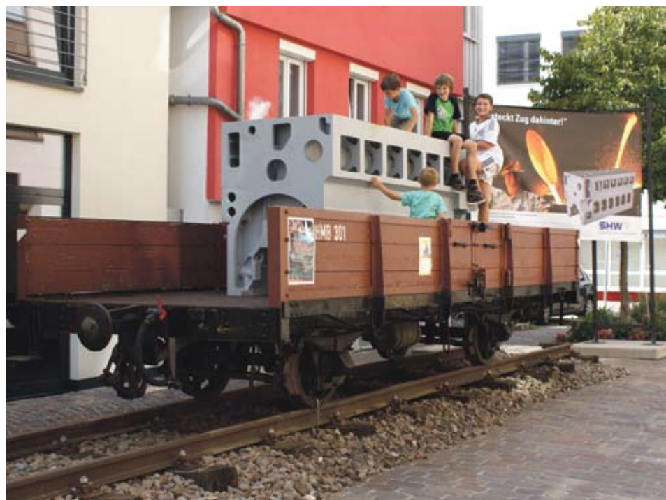
Ob großer Güterwaggon oder kleine Miniatureisenbahn - großen und kleinen Besuchern wird einiges an Spaß geboten.

Dokumentarfilm zu „150 Jahre Remsbahn“ im Kino am Kocher