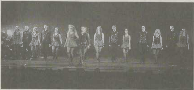
„To dance on the Moon“

eigenen Sehnsüchten zu tun hat. „To dance on the Moon“ erzählt eine Liebesgeschichte und verqu coast sie mit den Geheimnissen den Legenden und Weisheiten der keltischen Welt. Es geht um Wünsche und Vorstellungen, die tief in uns allen sitzen. Beispielsweise um den Wunsch, etwas anderes zu tun, seinem Leben eine neue Richtung zu geben, einen Traum zu leben. Manchmal erhalten wir in unseren Träumen einen Fingerzeig, wie es gehen könnte. Manchmal aber gelingt es, der eigenen Stimme zu gehorchen, eine grosse Energie zu entwickeln und den Weg zum Glück zu finden. Tanz, Rhythmik - kurz die Körpersprache der Tänzer bringt diese Gedanken zum Ausdruck. Das Publikum wird mitgenommen auf den Weg, der den Alltag verlässt. Es taucht ein in eine andere Welt, eine Welt voller Schönheit und Magie. Es ist die Welt der irisch-keltischen Mystik, die fremd und doch so vertraut ist, die auf uns eine ebenso suggestive Wirkung hat wie die Bewegungen, das Können der Tänzer. Karten sind im Vorverkauf beim Touristik-Service Aalen, Tel. 07361/52-2359 erhältlich.