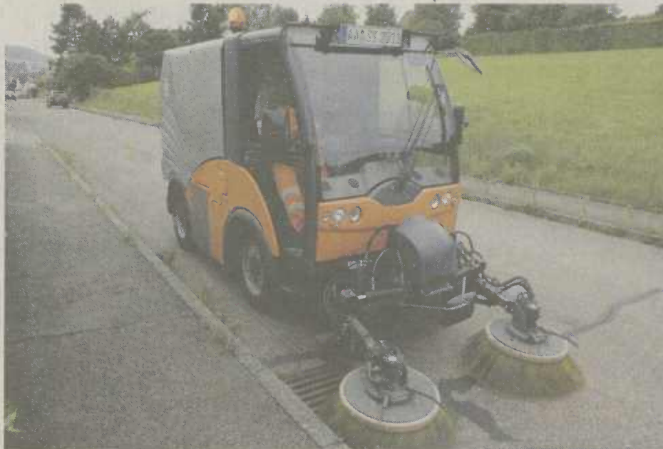
Der Bauhof-Mitarbeiter Roland Haschka mit der kleinen Kehrmaschine in der Hardtstraße

Diese erreichen in festem Turnus alle Bereiche der Flächenstadt Aalen. Der Reinigungsplan sieht vier Stufen vor: wöchentlich im Einsatz ist die Großkehrmaschine in der Innenstadt, am Krankenhaus, in der Industriestraße und Friedrichstraße / Stuttgarterstraße. In Stufe zwei sind die großen Zu-