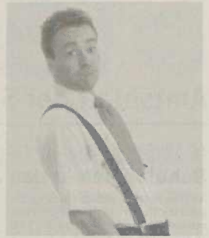
"Kabarettist Heini Öxle"

Der Stadtverband für Sport und Kultur Wasseralfingen freut sich Ihnen, unterstützt insbesondere durch die Löwenbrauerei Wasseralfingen und die Kreissparkasse Ostalb, diesen Abend bieten zu können.