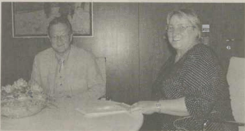
Oberbürgermeister Ulrich Pfeifle im Gespräch mit Marga Elser, MdB.

Abschließend bedankte sich OB Pfeifle bei der Abgeordneten dafür, dass der Bund zusammen mit dem Land nunmehr für die Fachhochschule Aalen mit der Bebauung des Burgen beginnend wolle. Dies sei eine wichtige Infrastrukturmaßnahme für den gesamten Ostalbkreis.