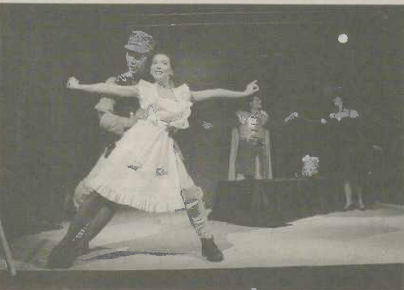
Die Liebenden von Ephesos - Sorbisches Nationalensemble Bautzen

Zur Vorweihnachtszeit gastiert das Tourneetheater Thespiskarren mit einer interessanten Inszenierung von „Der kleine Prinz“ am Sonntag, 16. Dezember in der Aalener Stadthalle. Mit Lichtanimation und Mitteln des schwarzen Theaters wurde das bekannte Buch von Antoine de Saint-Exupéry mit überwältigendem Erfolg inszeniert. Im Januar wird das Stadttheater Pforzheim die Mozartoper „Die Zauberflöte“ auf die Aalener Bühne bringen, weitere Höhepunkte dürften das Gastspiel des Theater Lindenhof/Melchingen, des sorbischen Nationalensembles Bautzen und das traditionelle Gastspiel des Stadttheaters Ulm mit der Operette „Die Csardasfürstin“. Nähere Informationen zum Programm und Buchung ist möglich unter Telefon: 07361/52-2359 beim Touristik-Service Aalen.