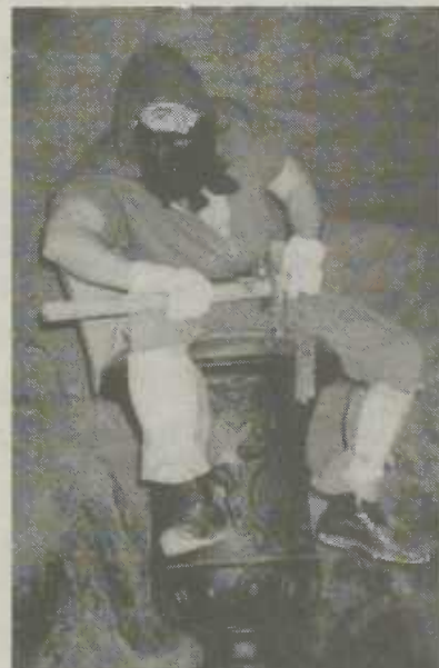
"Der Berggeist vom Tiefen Stollen"

Hinweis: In den Sandsteinhallen herrschen auch im Sommer Temperaturen um zirka 11 Grad. Bitte geeignete Kleidung tragen.