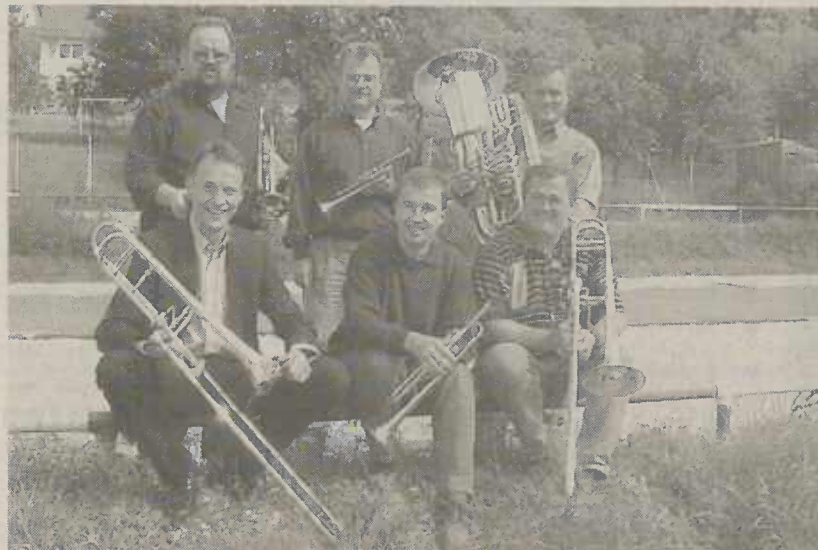
"Six for Brass"

Bereits bei ihrem Konzert vor 6 Jahren im ausverkauften Rathausfoyer waren die Zuhörer begeistert vom harmonischen Zusammenspiel und der Brillanz der Blechbläser. Karten gibt es im Vorverkauf bei MusikA, Telefon: 07361/61304 und beim Touristik-Service Aalen, Telefon: 07361/52-2359.