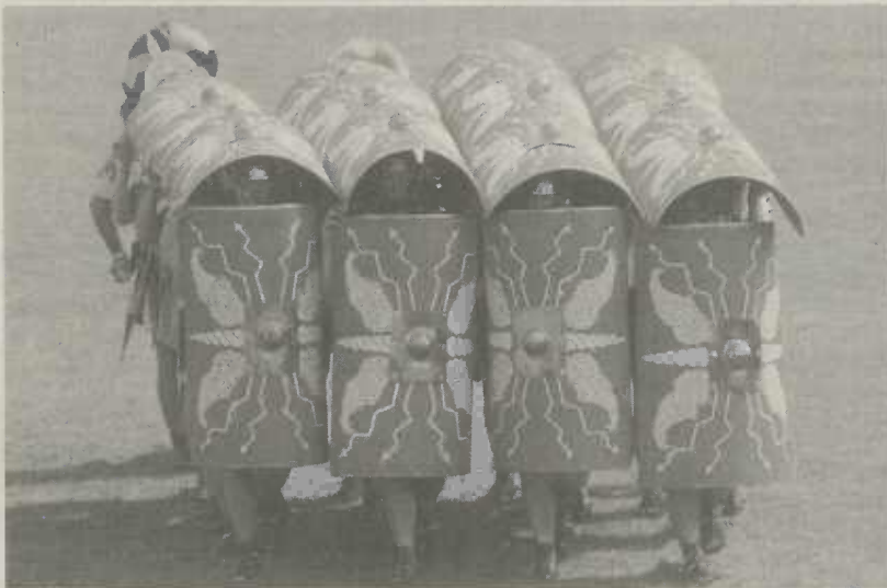
Ungarische Gladiatoren zeigen spannende Kämpfe und aus England wird die 40 Mann starke "Ermine Street Guard" erwartet, ein echter Höhepunkt der diesjährigen Römertage. Diese Gruppe besticht vor allem durch präzise militärische Vorführungen. Sie sind zum ersten Mal im Süddeutschen Raum zu sehen.

Wer das römische Leben ganz original und unverfälscht erleben möchte, ist bei den bereits zum achten Mal in Aalen stattfindenden Internationalen Römertagen am Samstag, 23. und Sonntag, 24. September 2006 richtig. Neben dem Limesmuseum Aalen wird auf dem Gelände des einstmals größten römischen Kastells nördlich der Alpen, das zum UNESCO Welterbe Limes gehört, ein buntes Kaleidoskop an römischem Militär- und Alltagsleben live vorgeführt.