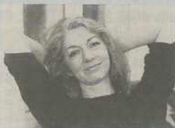
"Autorin Erika Pluhar"

Erika Pluhar liest am Mittwoch, 10. Oktober um 20 Uhr in der Stadtbibliothek Aalen aus ihrem aktuellen Roman „Verzeihen Sie, ist das hier schon die Endstation?“.