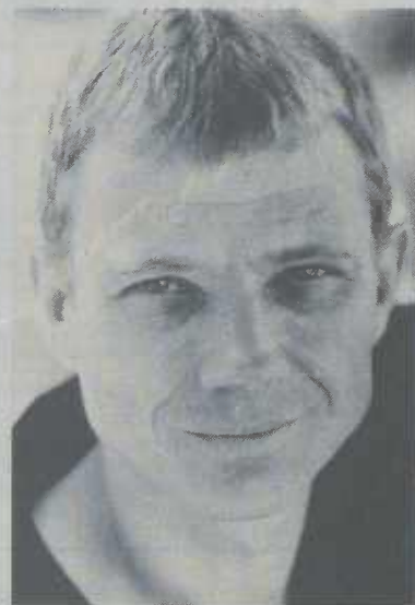
"Autor Ulrich Woelk"

Ulrich Woelk liest im Rahmen der „Literarischen Streifzüge 2001 - Von Liebe & Leidenschaft“ liest am Montag, 8. Oktober 2001 um 20 Uhr aus seinem aktuellen Roman „Liebespaare“ in der Stadtbibliothek im Torhaus. Sensibel, lakonisch und mit analytischem Blick portraitiert Ulrich Woelk Paare von heute, denen alle Möglichkeiten offen stehen und die doch die Freiheit oft nur als Orientierungslosigkeit erfahren. Auf der Suche nach der wahren, tiefen Liebe begeben sie sich auf konfliktreiche Umwege, begehren und benutzen, verlassen und verletzen. Ulrich Woelk, geboren 1960 in Köln, lebt als freier Schriftsteller in Berlin. Sein erster Roman „Freigang“ wurde 1990 mit dem aspekte-Literaturpreis ausgezeichnet. Seitdem sind die Romane „Rückspiel“ und „Amerikanische Reise“ sowie das Theaterstück „Tod Liebe Verklärung“ erschienen. Der Eintritt beträgt 10 DM/ermäßigt 7 DM. Das vollständige Programm der Li-