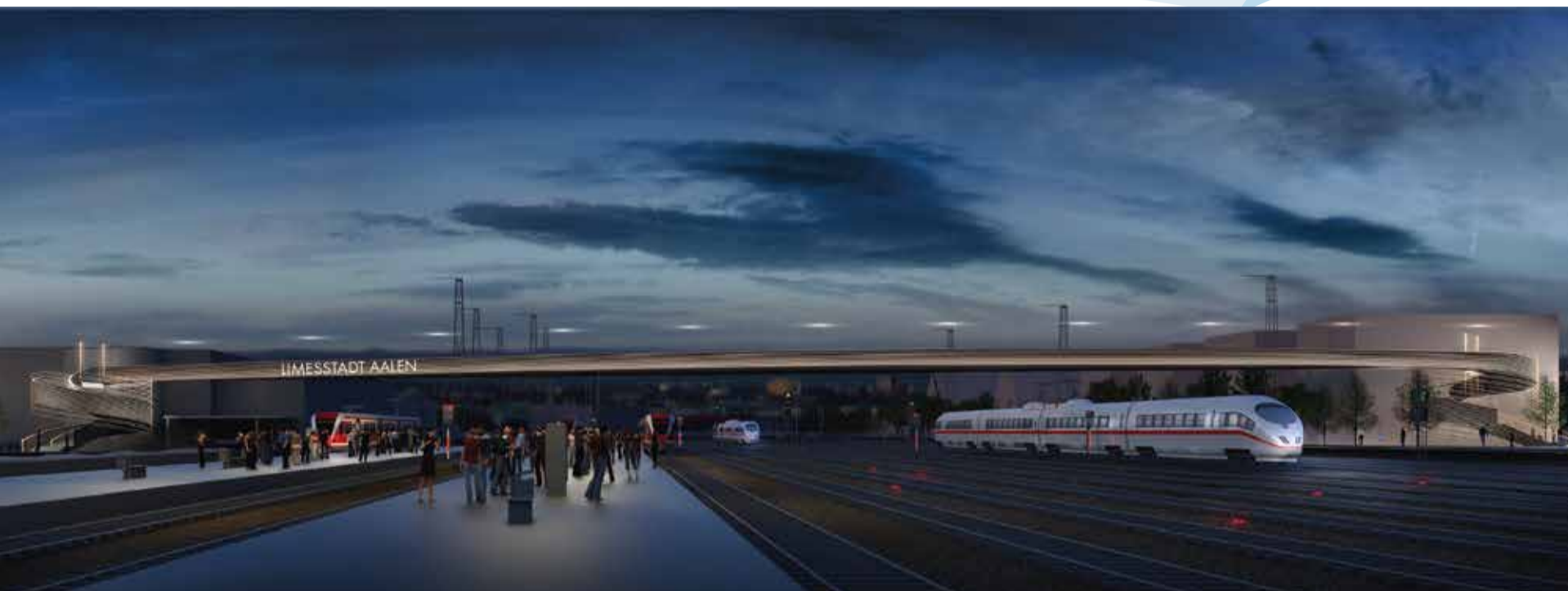
Visualisierung: Architekturbüro Werner Sobek

DER TECHNISCHE AUSSCHUSS HAT GRÜNES LICHT ERTEILT FÜR DIE LEISTUNGSPHASE 2