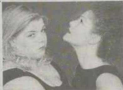
"Das Frauenduo Queen Bee"

Für die Qualität des Abends bürgt die Regie von Gerburg Jahnke von den Missfits.