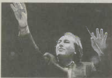
"Prof. Frieder Bernius"

Das Konzert findet in der Veranstaltungsreihe "Kulturbegegnungen" der Staatlichen Toto-Lotto GmbH Baden-Württemberg statt. Das Unternehmen verfolgt mit dieser Förderung das Ziel, die Vielfalt der Kulturlandschaft in den Regionen Baden-Württembergs zu erhalten und das nicht nur in den großen Städten des Landes. Der Erlös des Toto-Lotto-Benefizkonzertes soll für