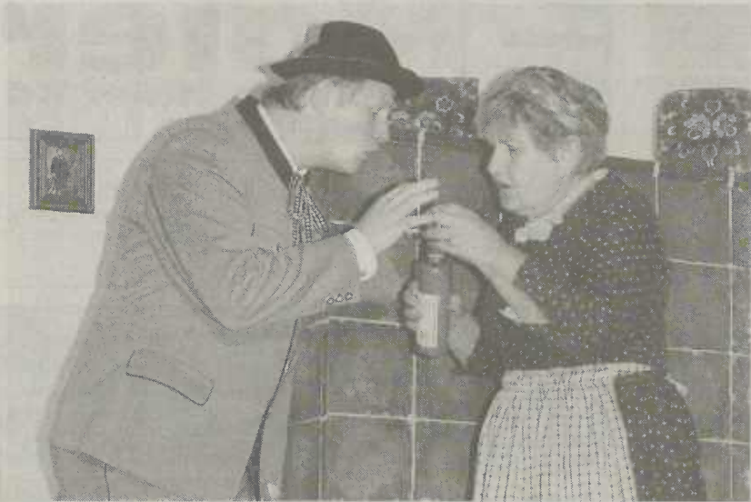
Szene aus "Seine Majestät der Kurgast"

denzimmern lässt sich die Haushaltskasse aufbessern. Daher hat Zensi und Resi beschlossen, Feriengäste ins Haus zu nehmen. So erscheinen alsbald Frau Brunnhilde Gänlein nebst Tochter Anita, aus Berlin, auf dem Anwesen der Draxl's. Als die beiden Männer erleben, was da hinter ihrem Rücken eingefädelt wurde, schauen sie erst einmal dumm. Doch dann versuchen sie mit allen ihnen bekannten Lausbubenstreichen, die beiden Urlaubsgäste zu vertreiben. Die pfiffige Magd Urschl fungiert als "diplomatische" Helferin. Lassen Sie sich überraschen, wie diese Lausbübereien enden. Karten gibt es im Vorverkauf ab sofort beim Touristik-Service-Aalen, der Bücherei Henne, Wasseraltingen und dem Bezirksamt Wasseraltingen.