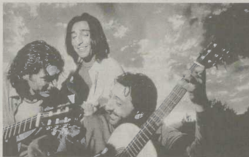
Ketama gatieren beim Jazzfest

Die übrigen Gottesdienste der Kirchen und Konfessionen entnehmen Sie bitte der Tageszeitung.