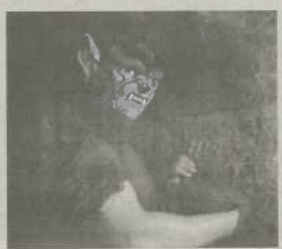
Der Werwolf der Unterwelt

Dank des Fußballvereines Viktoria stehen Parkplätze in ausreichender Zahl zur Verfügung. Der Außenbereich ist bewirtet.