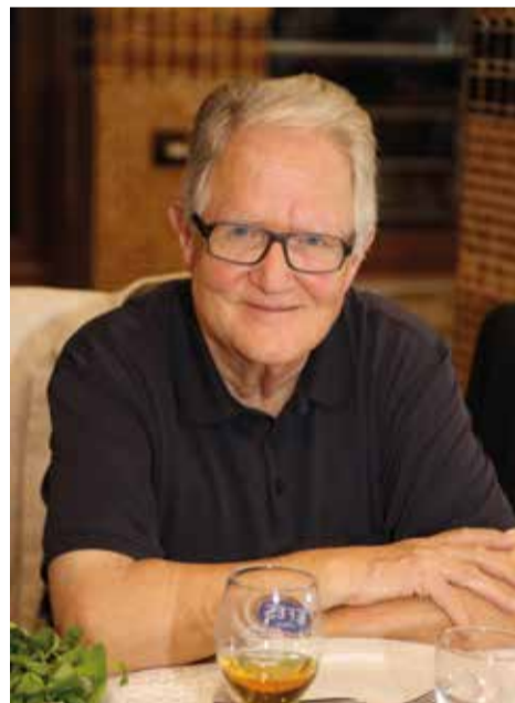
Oberbürgermeister a.D. Ulrich Pfeifle feierte seinen 75. Geburtstag.

Für seine Verdienste wurde Ulrich Pfeifle 1992 mit der Großen Ehrenplakette der Stadt Aalen in Silber und mit dem Bundesverdienstkreuz am Bande geehrt und 2002 mit dem Bundesverdienstkreuz Erster Klasse. 2003 wurde er zum Ehrensator der damaligen Fachhochschule Aalen ernannt, 2004 zum Ehrenbürger der ungarischen Partnerstadt Tatabánya.