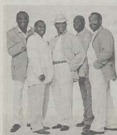
"Kool & the Gang"

Kool & the Gang sind nach 40 Jahren Funk und Soul mit zahllosen Chart-Platzierungen längst Ikonen der Black Music. Lamont Dozier war Teil von Holland/Dozier/Holland, die bei Motown zu den erfolgreichsten Songwritern der USA wurden. Heute singt er selbst und feiert seine Europapremiere auf dem Aalener Jazzfest. Nils Landgren stellt sein Projekt mit neu interpretierten Abba-Kompositionen vor. Soulounge tritt mit den Gaststars